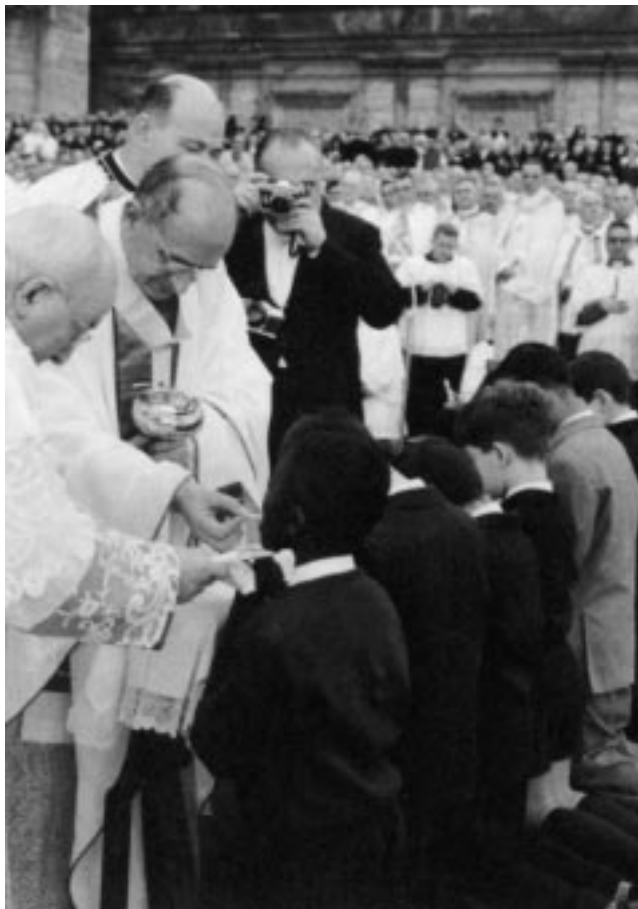
A distribuição da Sagrada Comunhão durante a Santa Missa, por ocasião do encerramento do Concílio Vaticano II (8 de Dezembro de 1965 “sacrato” da Basílica Vaticana)