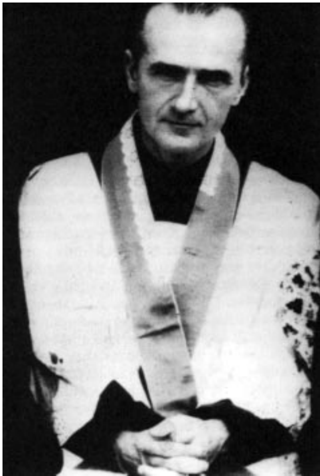
O Beato Alexij Saritski, sacerdote e mártir, um Santo eucarístico do tempo da clandestinidade soviética