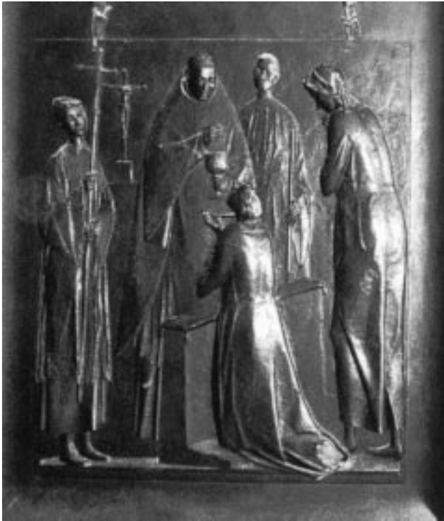
Portal direito da entrada da Basílica de São Pedro no Vaticano